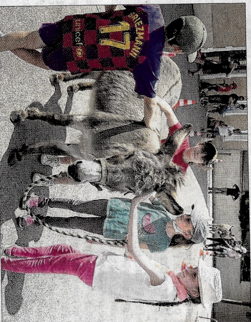
Les ânes de l'association Flores y Anes de Saint-Léger-sur-Dheune sont venus en visite à l'école de Charrecey.